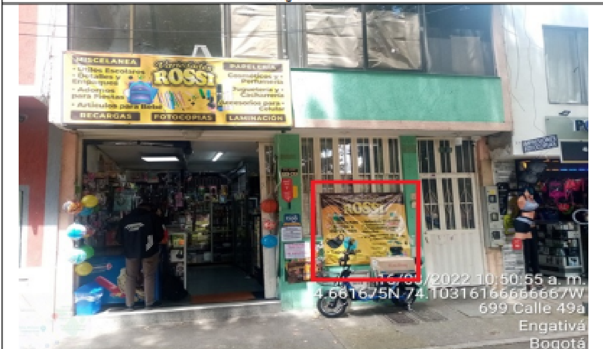
Fotografía No. 3

En la cual se evidencia un (1) elemento PEV, perteneciente al establecimiento comercial denominado VARIEDADES ROSSI , el cual se encuentra ubicado en las ventanas de la edificación.